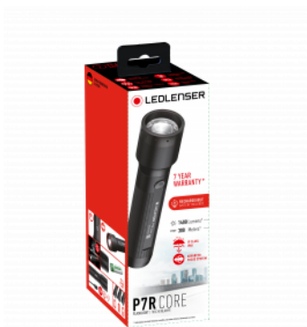
Példa illusztráció a csomagolásra